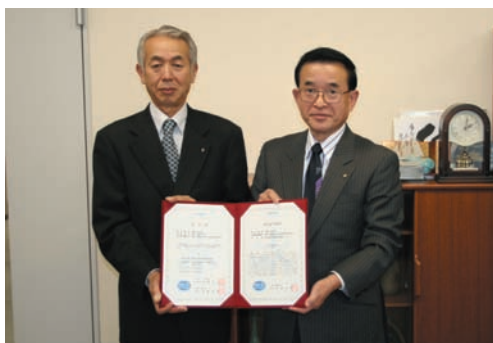
1月18日 藤吉工業株式会社 (申請番号：JWWA-GLP066)

水道 GLP 認定委員会で認定及び認定の更新が決定した下記の水質検査機関の認定証授与式を日本水道協会専務理事室において行った。