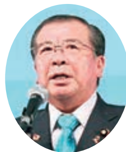
厚生労働大臣祝辞： 赤石厚生労働大臣政務官