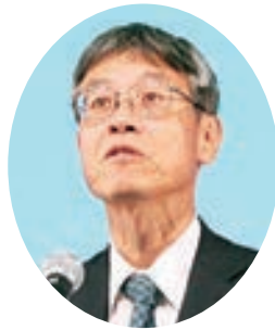
国土交通大臣祝辞： 海野国土交通省水管理・国土保 全局水資源部水資源計画課長