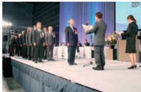
東日本大震災感謝状贈呈