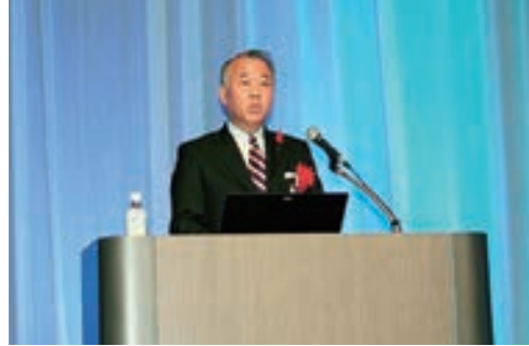
講師：降矢郡山市水道事業管理者