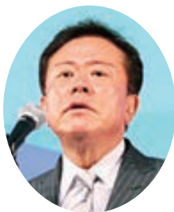
本協会代表挨拶： 猪瀬会長（東京都知事）