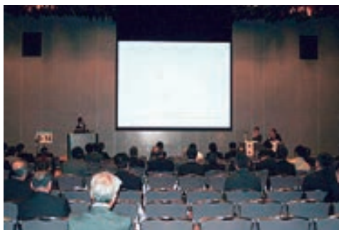
水道研究発表の様子

なお、同日午後から水道研究発表会が11部門に分かれて開催され、事務27、計画21、水源・取水9、浄水79、導・送・配水85、給水装置14、機械・電気・計装19、水質63、リスク管理・災害対策44、東日本大震災39、英語9、計409編の発表が行われた。