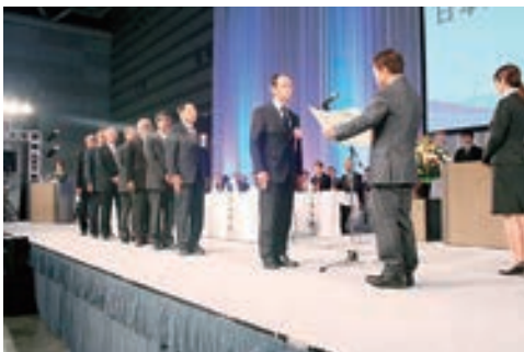
日本水道協会会長表彰