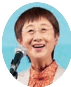
本協会東北地方支部長 挨拶：奥山仙台市長