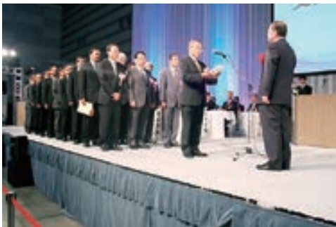
厚生労働大臣表彰