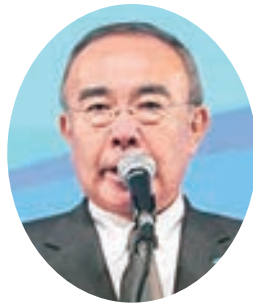
祝辞：益本日本水道 工業団体連合会会長