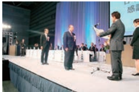
日本水道協会感謝状贈呈