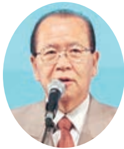
祝辞：高橋郡山市 議会議長