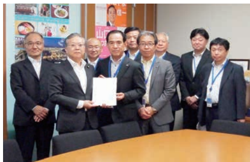
横山信一参議院議員