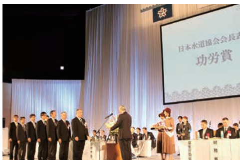
日本水道協会会長表彰（功労賞）