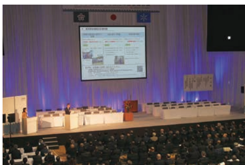
水道イノベーション賞事例発表