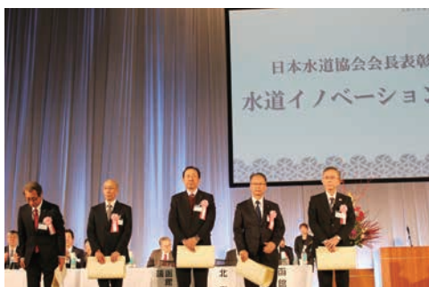
日本水道協会会長表彰（水道イノベーション賞）