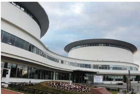
総会・特別講演・研究発表会会場：函館アリーナ

次に、厚生労働大臣（熊谷厚生労働省医薬・生活衛生局水道課長代読）、総務大臣（乾総務省自治財政局公営企業経営室長代読）、国土交通大臣（若林国土交通省水管理・国土保全局水資源部水資源計画課長代読）、北海道知事（佐々木北海道渡島総合振興局長代読）、木股日本水道工業団体連合会会長から来賓祝辞があった。