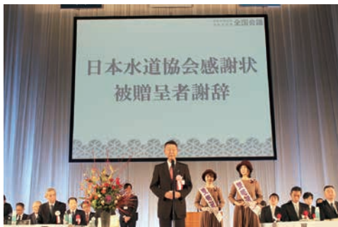
日本水道協会感謝状贈呈