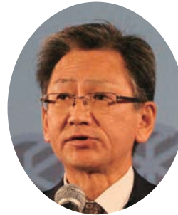
北海道知事祝辞： 佐々木北海道渡島総合 振興局長