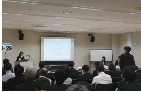
研究発表会の様子