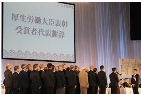
厚生労働大臣表彰