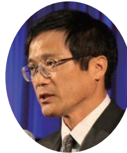
次年度全国会議開催地代表挨拶： 板橋仙台市水道事業管理者