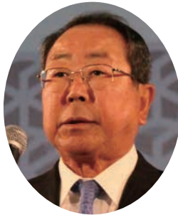
祝辞：木股日本水道 工業団体連合会会長