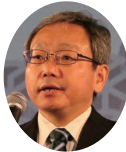
国土交通大臣祝辞： 若林国土交通省水管理・国土保 全局水資源部水資源計画課長