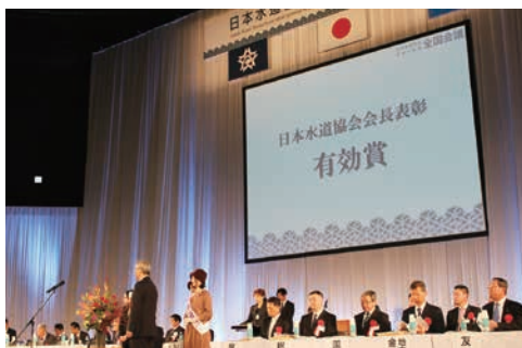
日本水道協会会長表彰（有効賞）