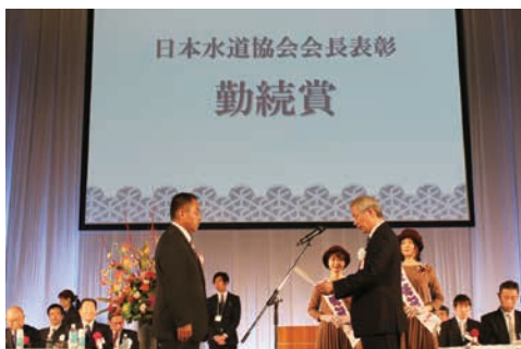
日本水道協会会長表彰（勤続賞）