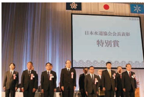
日本水道協会会長表彰（特別賞）