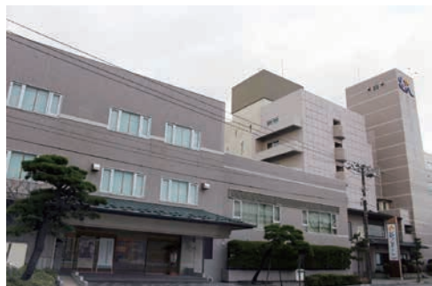
研究発表会会場：花びしホテル