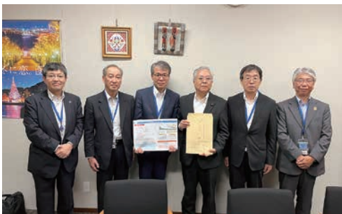
公明党上水道・簡易水道整備促進議員懇話会 幹事長 横山信一参議院議員への陳情