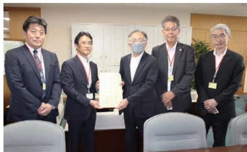
鎌水洋 環境省大臣官房長への陳情