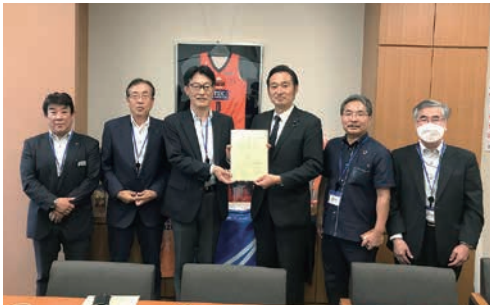
自由民主党水道事業促進議員連盟 深澤陽一衆議院議員への陳情