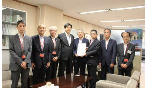
高橋謙司 国土交通省大臣官房総括審議官 への陳情