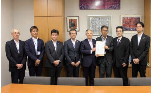
自由民主党水道事業促進議員連盟幹事長 盛山正仁衆議院議員への陳情