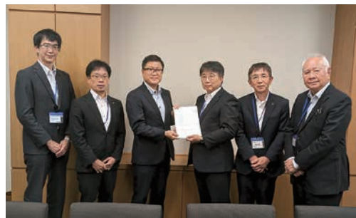
公明党上水道・簡易水道整備促進議員懇話会 幹事 日下正喜衆議院議員への陳情