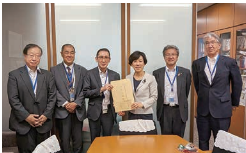
公明党上水道・簡易水道整備促進議員懇話会 幹事 山本香苗参議院議員への陳情