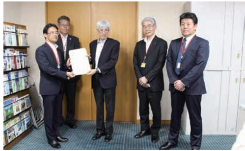
和田篤也 環境事務次官への陳情