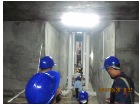
図 9 ろ過池地下