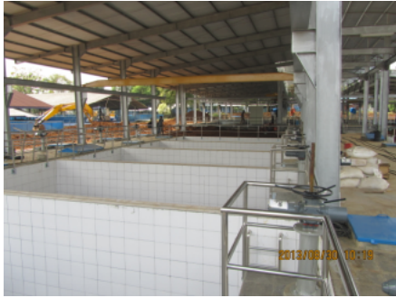
図 8 建設現場の様子