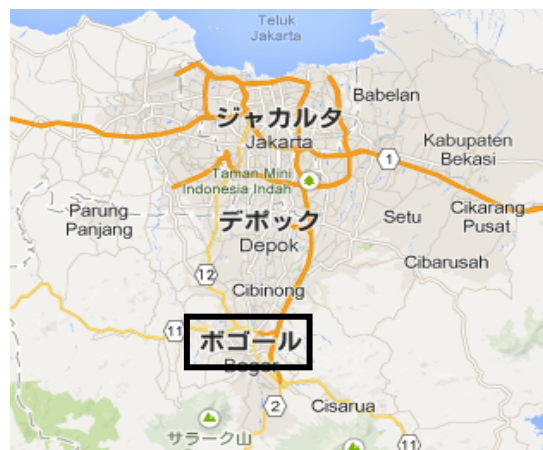
図7 Bogor の位置

管理室の機器はところどころ故障している箇所があったが、2時間ごとに濁度、取水量などの記録が取られていた。建設中の施設が稼働中の施設と同じ構造であったため、比較しながら見学することができた。また、砂ろ過池の地下なども案内していただき、逆洗をかけた時の汚泥の流れや沈澱池の地下構造が理解しやすかった。