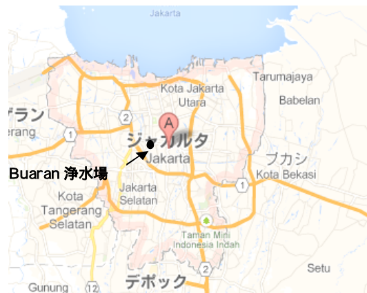
図 4 Buarun 浄水場の位置

今回、視察を行った浄水場は、「A」ジャカルタ特別市東部の浄水場の運営及び、管路による配水の管理をコンセッション方式で行っている民間企業である。