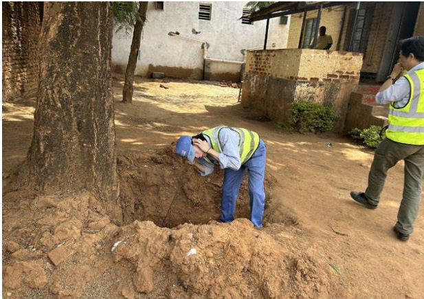
マラウイ国での漏水調査