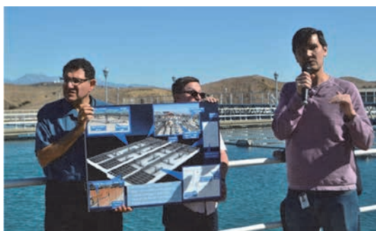
パネルを用いた説明