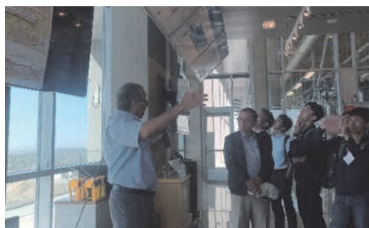
オゾン処理についての解説