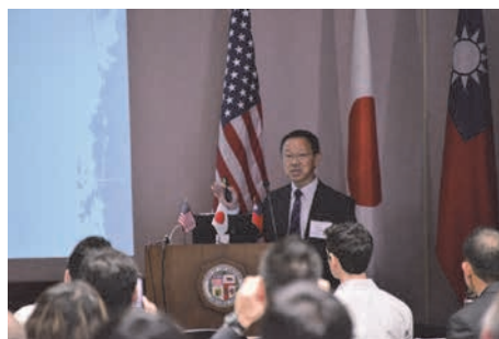
金沢大学教授 宮島昌克氏による基調講演