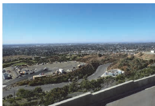
処理場からの眺望