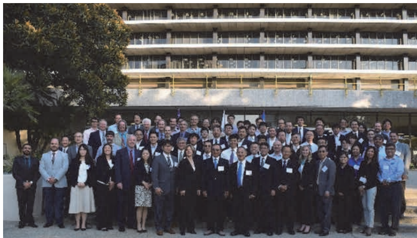
ワークショップ参加者の集合写真

参加3カ国において輪番で開催している本ワークショップは、次回第12回（2021年）を熊本市で開催する予定である。最新の研究の動向や知見の国境を越えた共有を図ることで、ライフラインを守る水道のより一層の強靱化に貢献していきたい所存である。