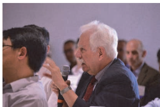
発表者へ質問を投げかける聴講者

れ、テーマ毎にセッションが設けられた。各セッションでは、1編当たり20分（発表15分、質疑応答5分）の持ち時間で、5編程度の論文が発表された。開催地であるアメリカからはオブザーバーの参加もあり、自国では見慣れない研究や取り組みへの理解を深めるため、聴講者が積極的に質問する光景がどのセッションでも見られた。