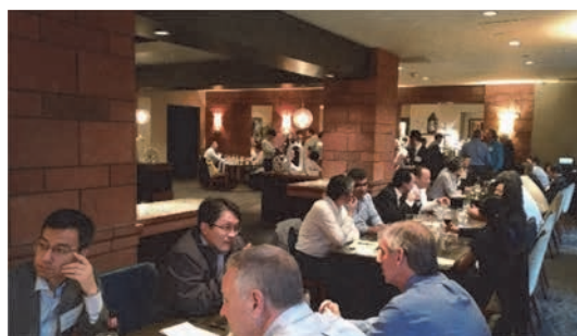
レセプションにて参加者が歓談