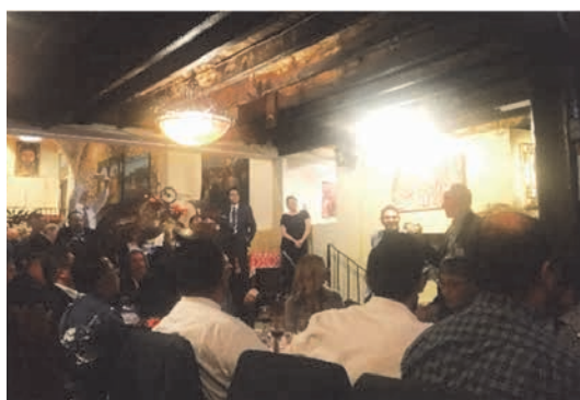
バンケットの様子

会場は大いに盛り上がった。ディナーは着席のビュッフェ形式で、座席は自由席となっていたことから、各自テーブルにつき米国と台湾からの参加者と交流を深めた。