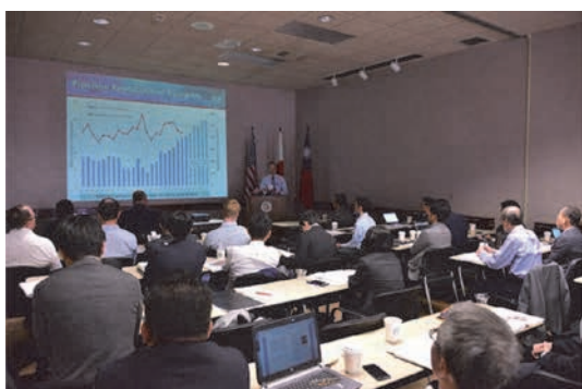
口頭論文発表の様子