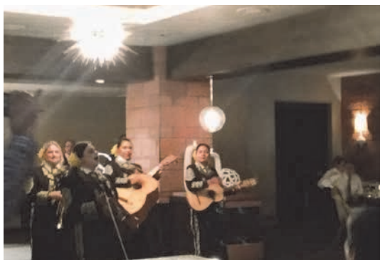
マリアッチバンドによる演奏