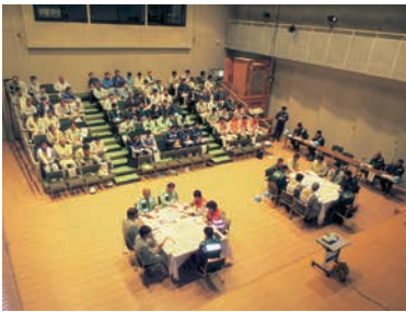
応援本部運営訓練（松本市）

今後も訓練内容の充実、発展を図り、相互応援体制をより強化していきたいと考えています。