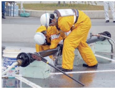
応急復旧活動訓練（金沢市）