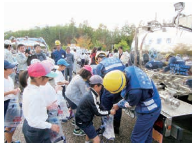
小学生による給水体験（多治見市）