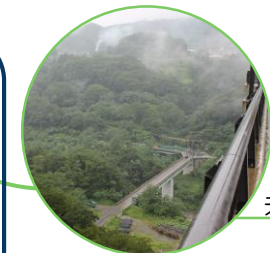
未完成の水源施設

水循環基本法 ・地下水を含む水を「国民共有の貴重な財産であり、公共性の高いもの」と法的に位置付ける(平成26年)